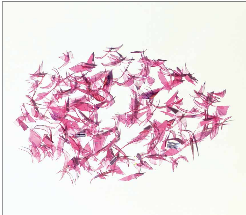
0 ml levendig , 2014, bouteille de shampooing, 60 x 80 x 4,5cm