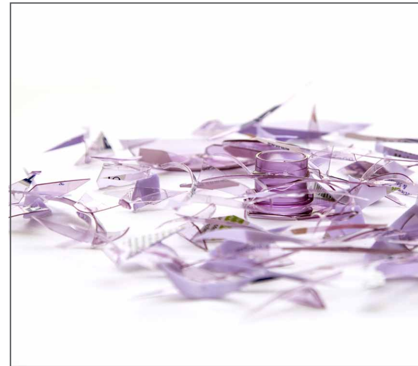
soft skin , 2014, bouteille de shampooing, 24,5 x 24,5 x 4,5cm