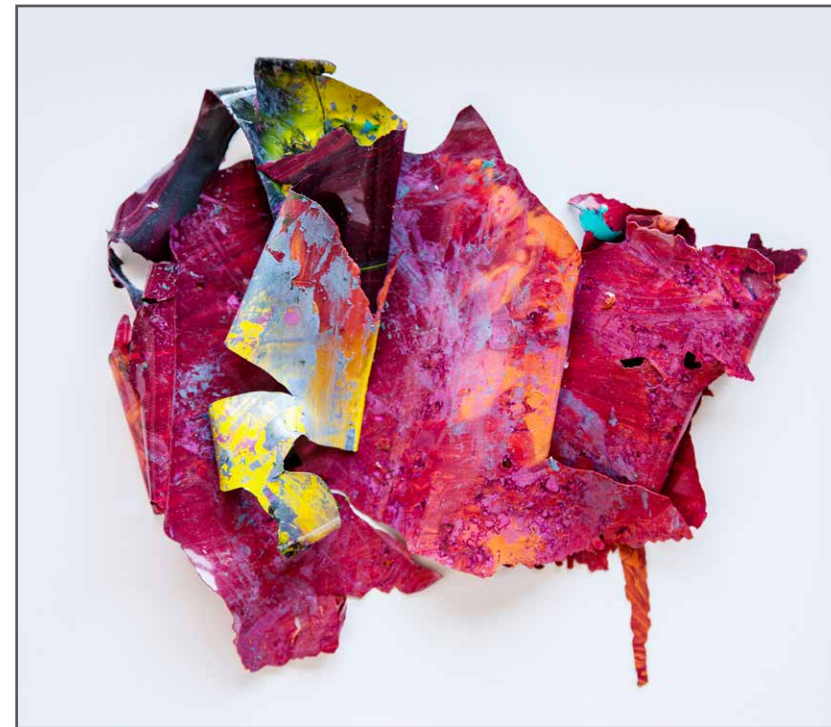
Cortex Colorix , 2015, la peinture, 33 x 33 x 3,5cm