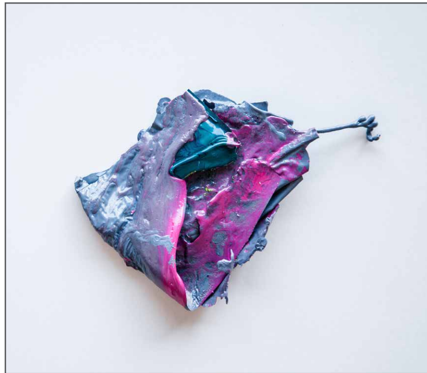
Cortex Colorix , 2015, la peinture, 23 x 23 x 3,5cm